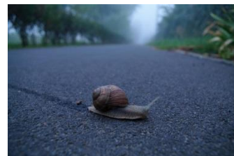
Sokan nem tudják, de az éti csiga is védett állat!

A víztározóban sok béka él (elsősorban kecske- és tavi béka), de a vízfelület olyan békafajoknak is fontos, amelyek nem vízi állatok. A barna- és zöld varangy például erdőkben lakik, a tavaszi szaporodási időszakban keresik fel a vizeket. Sajnos sok helyen az erdő és a víz között forgalmas út épült, ami több százezer béka pusztulását okozza évente. Nálunk tavasszal vagy nagyobb esők után a Páskomra menő műúton láthatjuk az elütött vagy szerencsésen átugró békákat, olykor tömegével. Aki ezen a gyér forgalmú úton halad, ilyenkor inkább szaladmozzon vagy fékezzen le. Más autókat nem zavarunk manővereinkkel, de akár több tucatnyi békát megmenthetünk. Ugyanez igaz az eső utáni reggeleken előbújó éti csigára, amely szintén védett állat. Nem szégyellnivaló vagy gyerekes dolog, inkább dicséretes természetszeretet, ha lehajolunk, és a csigákat átvisszük az út túoldalára.