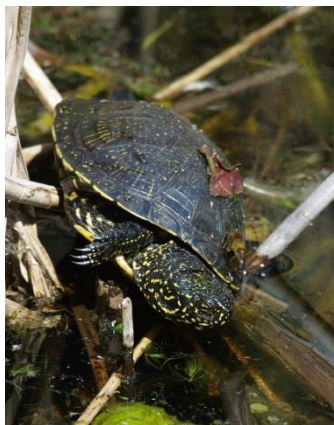
A mocsári teknős szívesen napozik a parton.

Nem véletlenül kapta nevét a vízisikló: nádasokban, tocsogós réteken tanyázik. Egy fehérvári madarász ismerősöm a víztározó mellett fotót is készített róla, bár ez a siklónak nem volt örömteli. A képen ugyanis a jókora hulló egy kígyászolyv karmaiban lóg. Ez a fokozottan védett ragadozó a vértesi erdők féltett madara, amely kifejezetten a kígyókra specializálta magát. Legyünk büszkéek rá, hogy a falu közvetlen közelében ilyen madárritkaság is felbukkan, márpedig ez csak a siklók jelenlétén múlik!