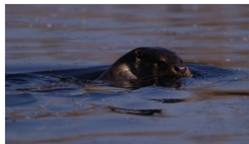
Gyakran csak így látjuk: gyorsan elúszó, mérgesen hátranéző vidra.

Hazánkban minden kétéltű (béka, varangy, göte), hulló (kígyók, teknős) és a denevérek összes faja természetvédelmi oltalom alatt áll. Ha tehát azt látjuk, hogy valaki bántja ezeket az élőlényeket, habozás nélkül erélyesen lépünk fel a természetkárosítás ellen! A vidra még különlegesebb eset, ugyanis ez a pompás állat fokozottan védett, eszmei értéke 250.000 Ft, így aki kezét emel rá, az már bűncselekményt követ el! Mindannyian sokat tehetünk azért, hogy ezek a fajok még sokáig itt legyenek velünk. Elég, ha odafigyelünk minden körülöttünk levő élőlényre, és ezt a féltő gondoskodást megtaníthatjuk gyermekeinknek is. Így Pátka még sokáig az lehet, ami most: gyönyörű természeti értékekkel rendelkező, békés és élhető falu.