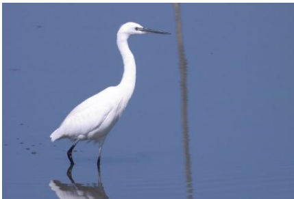
A kis kócsag a velencei-tavi nádasokból látogat el a Pátkai-víztározóra

Egy néhány évvel ezelőtti francia természetfilm gyönyörű mottója szerint „a vándormadarak ígérete a visszatérés”. Ennek a mondatnak a szívszorogató igazságát élhettük át az idei emlékezetes március során. Akik március 14-én valamelyik autópályán rekedtek, biztosan a hatalmas hófűvást jegyzik meg, ám a természetjárók, gazdálkodók, kertészkedők számára a március 25-27. közötti havazás volt a döbbenetesebb. Jómagam 26-án órákon át gázoltam a hóban Fehérvárról a Páskomba és vissza. A hóméző fölött mezei pacsirta, az erdőszéleken fekete rigó énekelt, az Árpád köz egyik kertjében búbosbankát láttam; ezt a költöző madarat eddig el sem tudtam képzelni havas körülmények között. A víztározó gátján haladva százával figyeltem meg vörösbegyeket, énekes rigókat, házi rozsdafarkúakat, cigánycsukokat. A parton a hullámoknak köszönhetően volt néhány centiméter széles hómentes sáv, így az amúgy vizekhez egyáltalán nem vonzó énekesmadarak itt csoportosultak, hogy a víz által kimosott magvakkal táplálkozzanak. A havas napokon a pátkai gólyapárnak még csak az egyik tagja érkezett meg, ő a Kábel-gátnál, az