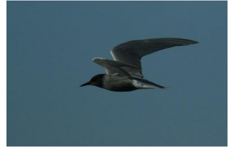
A kecses röptű kormos szerkő

Azóta viszont már Pátka is büszkélkedhet ritka madárral. Ha valaki idén február 17. és 20. között horgászott vagy sétált a pátkai gátórház környékén, egész biztosan látott legalább öt-hat vadidegen embert, akik állványos távcsővel kémlelték a víztározó madarait. A Pátkai Hírek márciusi számában bőven ejtettem szót a víztározón látható sirályokról, és csak a lapzártán múlt, hogy a tó eddigi legnagyobb madártani szenzációjáról a mostani számban adjak hírt: a víztározón tanyázó sirálytömegben egy sarki sirály bukkant fel. Ennek a sarkvidéki ritkaságnak ez csupán a második bizonyított magyar megfigyelése volt! Elég valószínű, hogy a hazai madarásztársadalom még évekig összekapcsolja Pátka nevét a sarki sirállyal. A madár hírére ideérkező lelkes megfigyelők közül a legtöbben még sosem jártak erre, őket nem csak a ritka madárfaj, hanem a tó többi érdekessége is lenyűgözte.