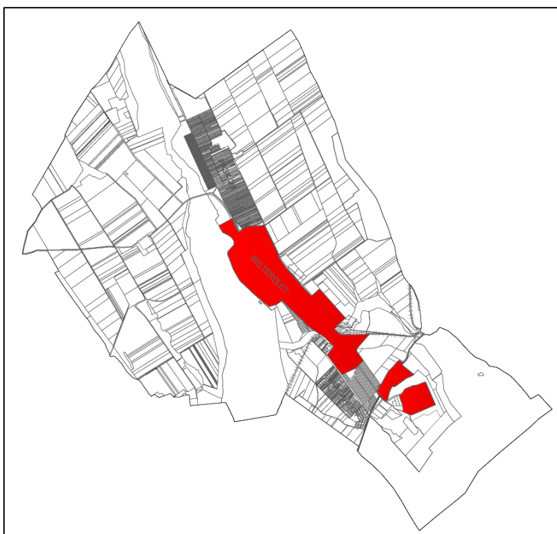
4. ábra Pátka község belterületi akcióterülete

Több területen (pl: zöldfelületek) jelentkeznek problémák. A fenti tények alapvetően indokolják a városrész akcióterületként történő kezelését.