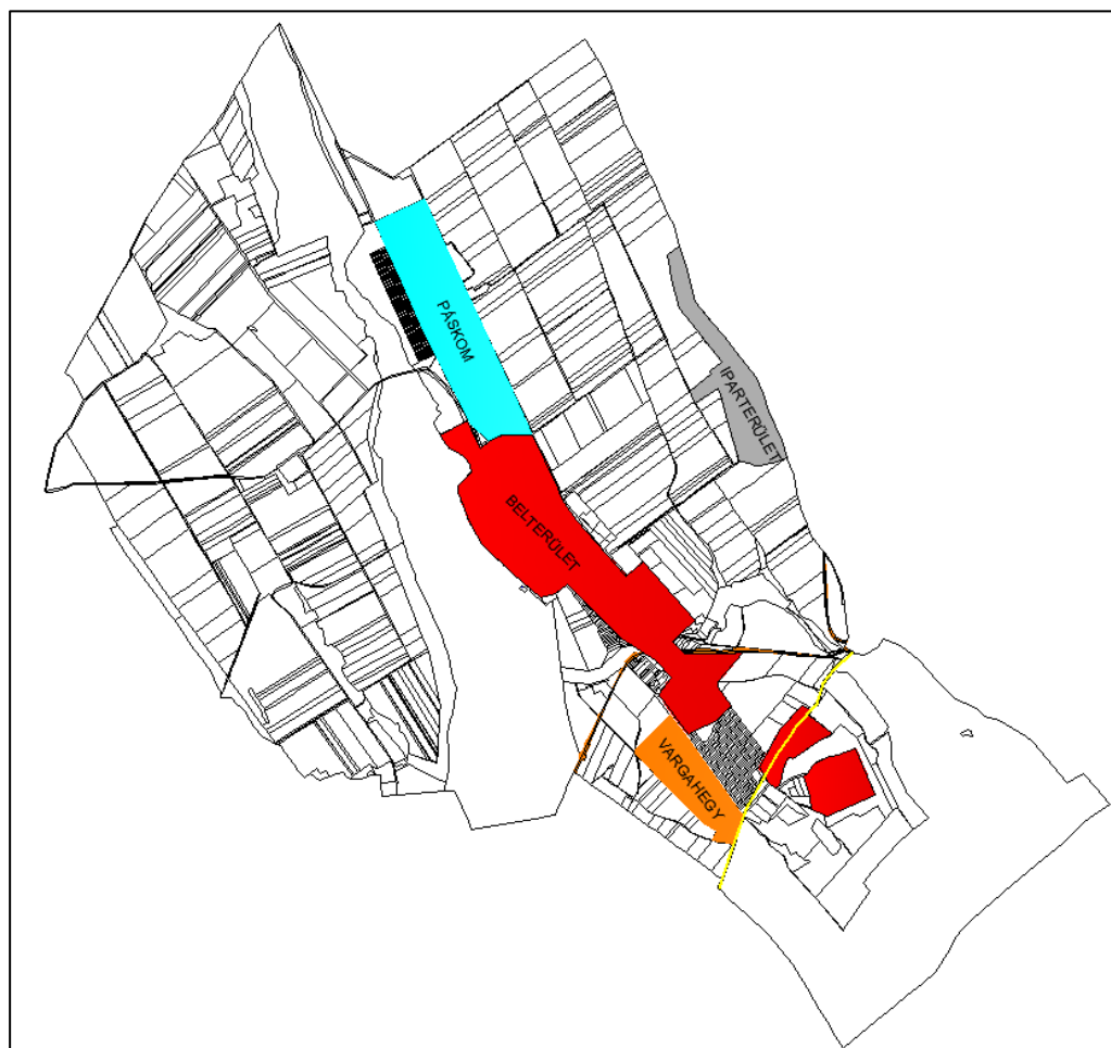
3. ábra Településrészek

A település közigazgatási területén szegregált terület vagy szegregációval veszélyeztetett terület nem található.