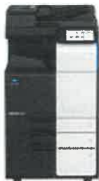
Bizhub C250i.jpg 60K