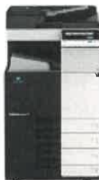
Bizhub C368.jpg 191K