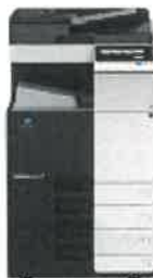
Bizhub C258.jpg 66K